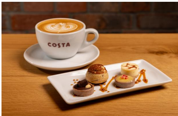
デザートプレート (税込 1,280 円)

「コスタコーヒー CURA 銀座店」には、ロイヤルホールディングス開発・監修の新しいフードメニューが登場します。「デザートプレート」はコスタコーヒーでのカフェ体験をより贅沢なひとときに感じてもらえるように、見た目や味にこだわった 4 種類を濃厚なキャラメルソースと合わせて作っています。「プチご褒美(普段のちよつとしたご褒美)」をキーワードにフレーバーや食感が異なる一口サイズのスイーツを厳選しております。またスープは濃厚な 2 種類をご用意しております。コーンスープであれば紅はるか、マッシュルームであればごろごろと入ったくみと合わせることで贅沢感と満足感を感じてもらえるようなスープにしております。スープセットとしてスープから 2 種類、パンから 3 種類ひとつずつ選んで頂くセットもご用意しております。