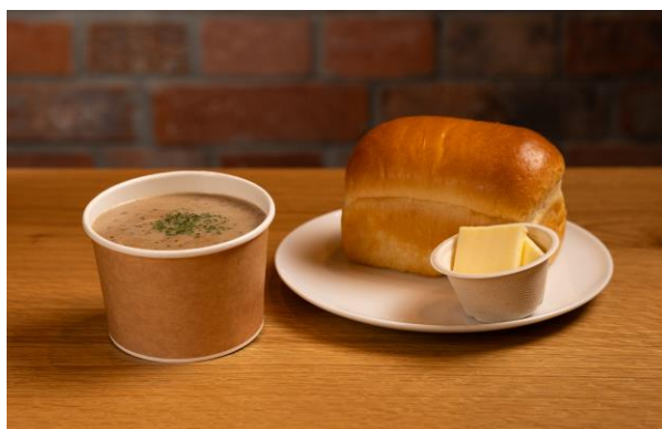
スープセット (税込 770 円)